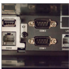
Viele Schnittstellen für Peripheriegeräte