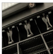
Große und robuste Stahlschublade