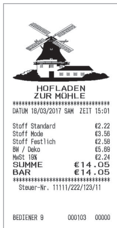
Die Abbildung ist stark verkleinert!