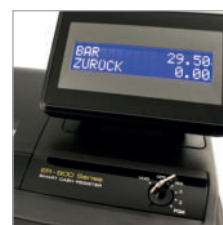
Leicht lesbares Bedienerdisplay