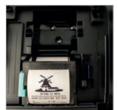
Schneller und leiser Thermodrucker